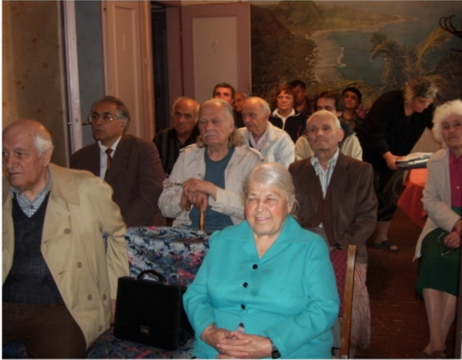
Yleisiä kokouksia Bulgariassa