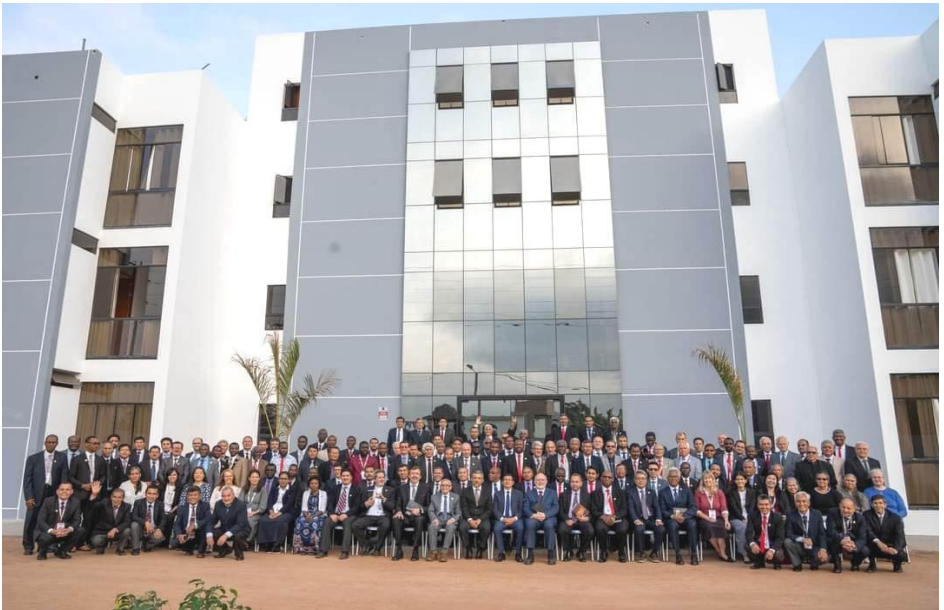
Kaikki edustajat ja tulkit