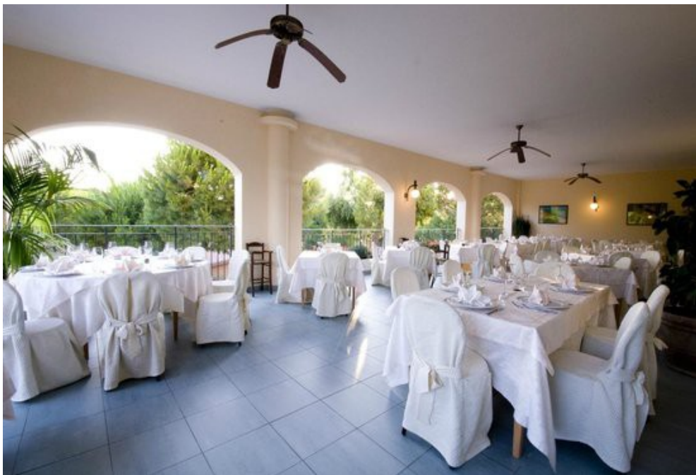
Ravintola Italian juhlapaikalla

Kansainväliset nuoris juhlat ja retki Italiassa - 01-09.10.2017 Hintaa 390, 00 € lisätietoa ja ilmoittautuminen: www.sda1844.org